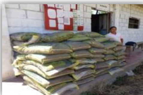
Foto 12 y 13: Suministro de de semillas, abonos, materiales y herramientas por parte del proyecto, para la implementación del bio-huerto en la localidad de Bolívar.

En la zona de Chazuta, los biohuertos se realizaron en la localidad de Tununtunumba, se cultivaron las siguientes especies: rabanito, lechuga, tomate, pepinillo, culantro y cebolla china.