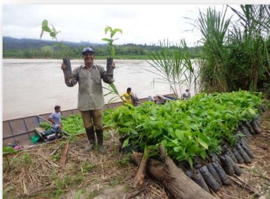
Foto 4: Traslado de plántones a campo definitivo por vía fluvial en la localidad de Sión.

Esta actividad tiene como propósito la instalación de cien (100) hectáreas de cacao en campo definitivo, injertados con clones de alto rendimiento. En el año 2013 se logró la producción de plántones para 50 hectáreas, logrando instalar en campo definitivo 15 hectáreas. En el 2014 se produjeron plántones para las 50 hectáreas complementarias, logrando instalarse 100 hectáreas en campo definitivo y de ello la injertación de 50 hectáreas, quedando pendiente injertar las últimas 50 hectáreas provistas para el año 2015. Es pertinente precisar que a finales del mes de agosto del 2014 el CORAH hizo su ingreso en el valle del Sión con la finalidad de erradicar las plantaciones de coca. Esta acción generó resistencia en toda la población afectando el normal desarrollo de las actividades programadas por el proyecto en la zona.