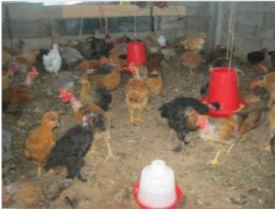
Foto 8: Población de gallinas criollas aptas para la comercialización

2.30 kg;. La producción obtenida se comercializó en el mercado local, obteniendo ingresos por un monto de S/. 7,774.00. Entre los logros más importantes tenemos los siguientes: