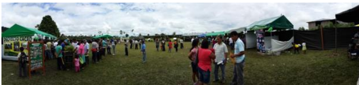
Foto 87: Vista panorámica de la feria de servicios agrarios realizada en la localidad de Las Palmeras, distrito de Nuevo Progreso, provincia de Tocache.