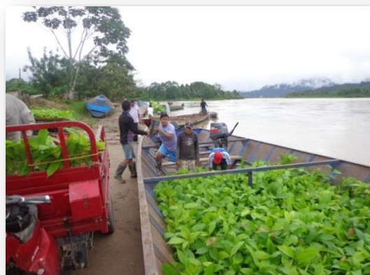
Foto 5: Participación activa de los productores en el traslado de los plántones hacia campo definitivo en la localidad de Sión.