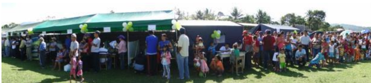
Foto 84: Vista panorámica de la feria de servicios agrarios realizada en la localidad de Tununtunumba, distrito de Chazuta, provincia de San Martín.