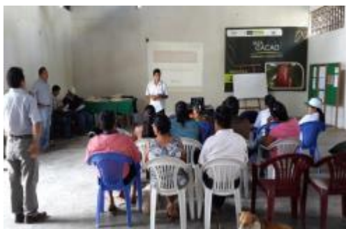
Foto 27: Socialización de avances y logros del proyecto en el 2013 – localidad de Nueva Bambamarca-diciembre 2013.