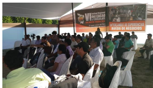
Foto 37, 38, 39 y 40: Pasantía de intercambio de experiencias exitosas en el cultivo del cacao en el marco del VI Festival Regional del Cacao y Chocolate.