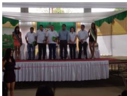
Foto 46: Ceremonia de Inauguración de la EXPO CACAO Tocache 2013 – diciembre 2013

En el 2014 el equipo del proyecto, que formó parte de la comisión multisectorial para el desarrollo del VI festival Regional del Cacao y Chocolate – 2014 en Juanjui.