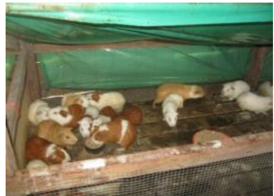
Foto 10: Plantel de cuyes hembras en gestación –comunidad de Manteca.

La implementación de los biohuertos se inició en el mes de noviembre en la localidad de Bolívar en 1000 m 2 de área; participaron diez productores y las principales actividades realizadas fueron: a) preparación del terreno con