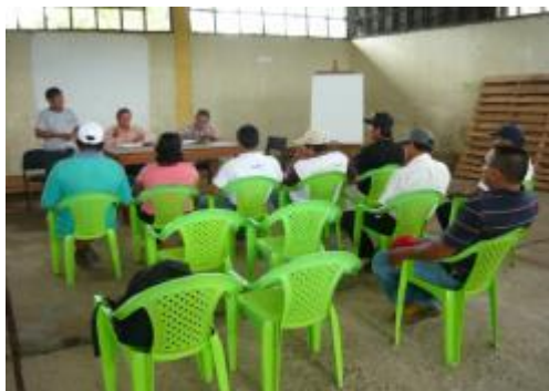
Foto 34: Reunión sostenida con Directivos de CP CACAO en Nuevo Horizonte – 27 de diciembre.