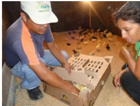
Foto 18: Entrega de pollos bb en la implementación de actividades productivas con asociados de ASPROC NBT (setiembre 2014).

En el año 2014, en el mes de setiembre, involucrando a dos nuevos núcleos de productores de Nueva Bambamarca, con quienes se implementaron dos módulos de crianza de aves, en cada módulo participan diez productores de cacao; al igual que en el ejercicio anterior, el proyecto suministró 250 aves a cada núcleo, alimentos, vacunas, vitaminas y equipo básico para la crianza. La saca está proyectada para la temporada de navidad.