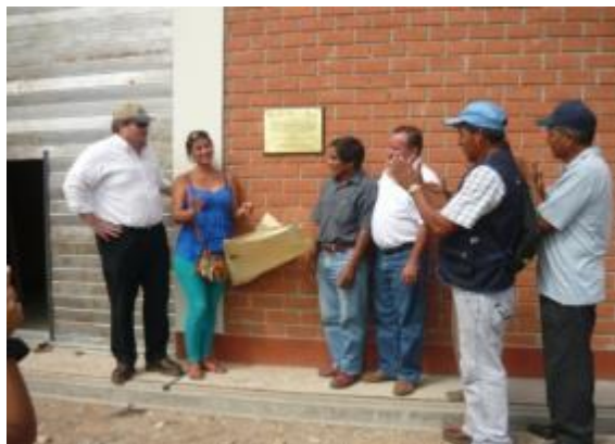
Foto 3: Inauguración del módulo post cosecha localizado en la comunidad de Manteca (28/06/2013)

En el proceso constructivo del módulo de La Victoria se generó un deductivo de obra N° 1 aprobado por el GORESAM mediante Resolución Ejecutiva Regional N° 502-2013-GRSM/PGR del 15 de julio 2013, por S/. 114, 406.78 (Ciento Catorce Mil Cuatrocientos Seis con 78/100 Nuevos Soles), el mismo que estuvo referido a la la partida 03.01 “Instalación de Riego Tecnificado”, al comprobarse limitadas condiciones técnicas para su construcción.