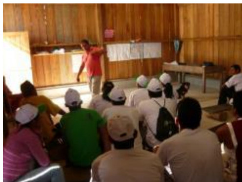
Foto 25: Socialización de avances y logros del proyecto en el 2013 – localidad de Mojarras-diciembre 2013.

En el marco de la aplicación del plan de comunicaciones, en el año 2013 se desarrollaron actividades como: notas de prensa, publi-reportajes, pasantías e intercambios de experiencias con la participación de productores agrarios líderes en el cultivo de cacao; en el mes de diciembre, como cierre de año, se efectuó ante las OPAs, la socialización de los avances y logros del proyecto en el año 2013; asimismo, de las actividades a realizarse en el año 2014. Este proceso fue bien recibido por las organizaciones, generando mayor apertura hacia el Gobierno Regional y la cooperación internacional - USAID. (ver fotos de los talleres realizados).