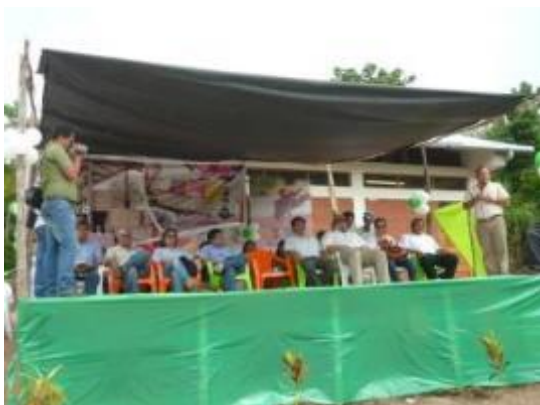
Foto 1: Inauguración del módulo post cosecha localizado en La Banda de Chazuta (26/06/2013)

Los procesos de recepción de la obra se iniciaron con la conformación del comité de recepción de obras mediante RGGR N° 149-2013 GRSR/GGR del 16/08/2013; este comité recepcionó las obras con fecha 01/10/2013; la aprobación de la liquidación correspondiente se hizo con fecha 13/12/2013 por el monto de S/. 2` 200,946.30, cancelándose el saldo a la empresa contratista el 27/12/2013 por el monto de S/. 35,647.59.