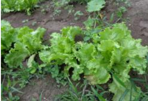
Foto 14: Cultivo de lechuga instalado en el biohuerto de Tununtunumba-Chazuta.