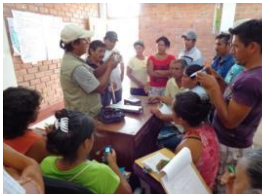
Foto 77: Sesión de control de calidad – Santa Rosa de Shapaja - CAT