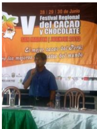
Foto 41: Conferencia de prensa de lanzamiento del V Festival Regional del cacao y chocolate – junio 2013