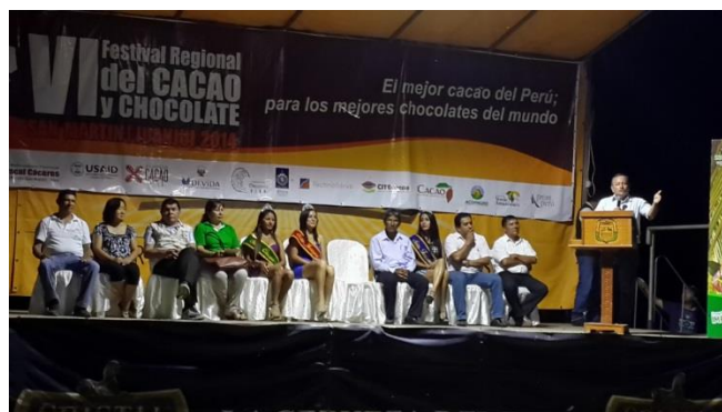
Foto 47, 48 y 49: VI Festival Regional del Cacao y Chocolate 2014

El equipo técnico administrativo del proyecto participó en el V Salón del Cacao y Chocolate realizado en julio 2014 en la ciudad de Lima y como parte de esta agenda y previo a este evento, se desarrolló un proceso de capacitación en temas de comercio exterior y logística internacional, visitándose empresas como: EXPOCAFÉ S.A., APP CACAO, MAGELLAN LOGISTICS, ATEXA – Atlantic Export S.A., Junta Nacional del Café – JNC, ACPC PICHANAKI, RANSA, EXPOCAFÉ, CECOCASA. Esta agenda concluyó el 4 de julio.