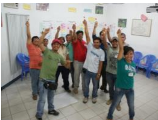
Foto 74: Dinámica grupal durante la capacitación ECA