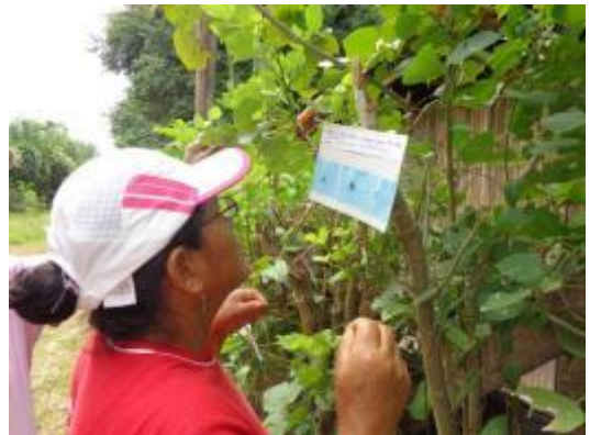
Foto 81: Prueba de caja – La Victoria – ACOPAGRO