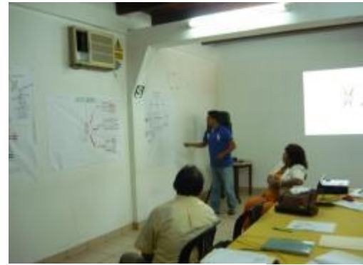
Foto 32 y 33: Participación del equipo en temas de producción textual

En la última semana del mes de diciembre – 2013, se desarrollaron reuniones de trabajo para tratar estrategias de articulación financiera y comercial con las organizaciones cacaoteras localizadas en la Provincia de Tocache teniendo como aliado estratégico a la ONG Capirona Investigación y Desarrollo; el propósito de esta actividad es facilitar el acceso a recursos financieros nacionales o europeos para la campaña 2014 del cacao, con la perspectiva de operar en forma plena los centros de acopio construidos en esta zona, (ver fotos del desarrollo de las reuniones).