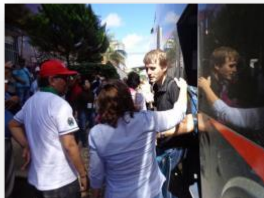
Foto 43 y 44: Empresarios chocolateros participantes de la ruta del cacao en Tocache – julio 2013.