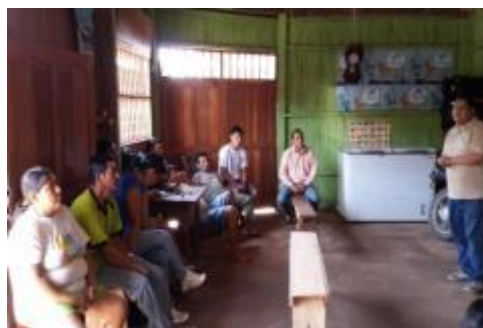
Foto 28: Socialización de avances y logros del proyecto en el 2013 – localidad de San Ramón-diciembre 2013.