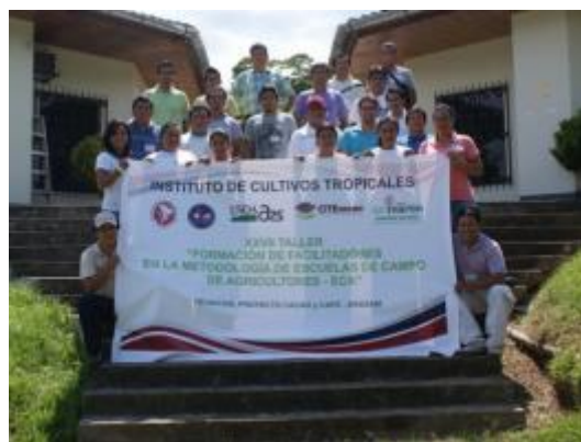
Foto 75: Promoción de participantes en metodología ECA, conjuntamente con los integrantes del proyecto.