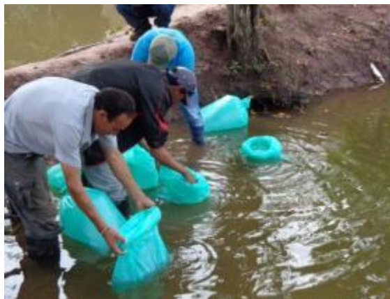
Foto 7: Desdoble de área de los peces con participación de los involucrados en Santa de Shapaja.

Las acciones que comprenden en el año 2013 involucran cuatro actividades productivas. En la provincia de Tocache, se implementó la crianza de peces desde el mes de octubre; donde el proyecto suministró los alevinos, alimentación y asistencia técnica, contando con la colaboración de la la dirección de producción a través de su equipo descentralizado; se logró la producción de 600 kilogramos de pescado. Aproximadamente.