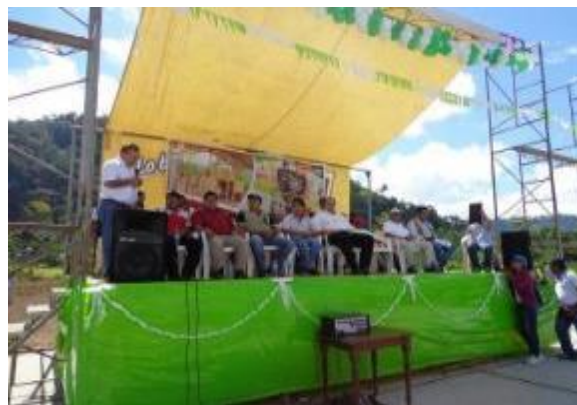
Foto 2: Inauguración del módulo post cosecha de cacao en la localidad de Santa Rosa de Shapaja - distrito de Uchiza (28/06/2013)