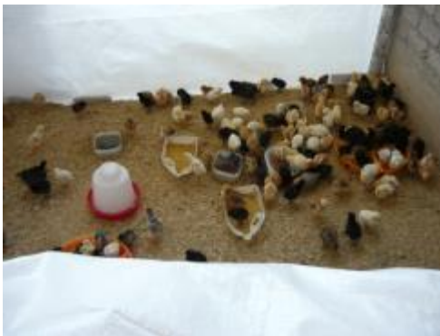
Foto 16: Visita al módulo de crianza de aves de la localidad de Dos de mayo – 11 de diciembre.