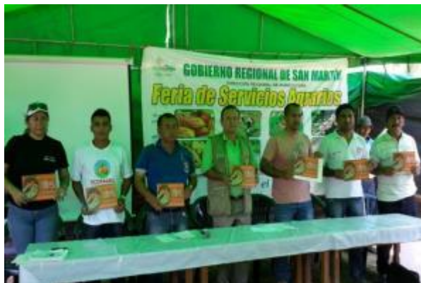
Foto 86: Acto inaugural y lanzamiento de la cartilla TAPS en la feria de servicios agrarios realizada en la localidad de San Ramón, distrito de Pachiza, provincia de Mariscal Cáceres.