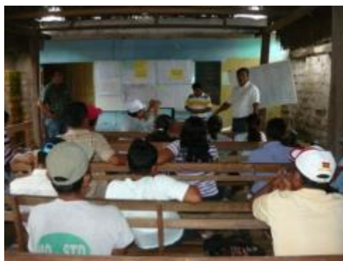
Foto 29: Socialización de avances y logros del proyecto en el 2013 – localidad de Chazuta-diciembre 2013.

Asimismo, entre el 16 al 19 de diciembre - 2013, se realizó un taller de capacitación al equipo técnico y administrativo del proyecto; la temática fue la siguiente: manejo de herramientas de comunicaciones, Ley de Sociedades, Ley de Cooperativas, organización y constitución empresarial, Ley del Impuesto a la Renta, Ley de Promoción a la Inversión en la Amazonía "Ley 27037", Ley General de Aduanas, Introducción a la gestión económica y financiera con enfoque en agro-negocios y elementos de producción textual, (ver fotos de la capacitación).