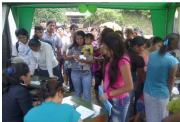
Foto 85: Inscripción de asistentes en la feria de servicios agrarios realizada en la localidad de Santa Rosa de Shapaja, distrito de Uchiza, provincia de Tocache.