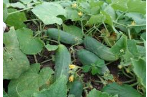
Foto 15: Cultivo de pepinillo instalado en el biohuerto de Tununtunumba-Chazuta.

Respecto a la crianza de aves en las localidades de Dos de Mayo y Mojarras, comprensión de la provincia de Mariscal Cáceres, se lograron menores niveles de sobrevivencia (alrededor del 50%), los involucrados en los núcleos de crianza carecían de experiencia y presentaron pocas habilidades en el manejo de este tipo de aves que requieren mayor cuidado, buen cumplimiento del calendario sanitario, manejo de la alimentación; sobre todo en los primeros quince días de crianza. Se suma a ello el poco soporte proporcionado por la empresa proveedora de los semovientes; en San Ramón el nivel de sobrevivencia alcanzado fue de 75%, las lecciones aprendidas en esta actividad son: