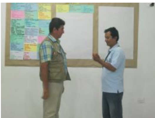
Foto 72: Capacitador ECA del ICT impartiendo la aplicación de la metodología a un integrante del equipo técnico del proyecto.

En el año 2013 se realizó una capacitación a los especialistas y técnicos del proyecto en el manejo de la metodología de escuelas de campo (ECAs), que tuvo lugar en el fundo "Juan Bernito" del Instituto de Cultivos Tropicales que se localiza en el distrito de La Banda de Shilcayo, provincia y departamento de San Martín.