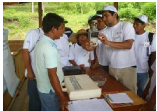
Foto 83: Sesión control de calidad – La Banda de Chazuta - ALLIMA CACAO