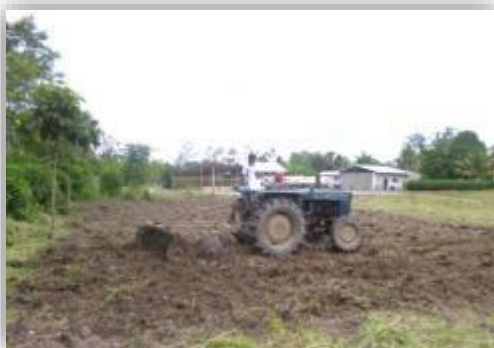
Foto 11: Mecanización de terreno donde se viene instalando el biohuerto – localidad Bolívar.