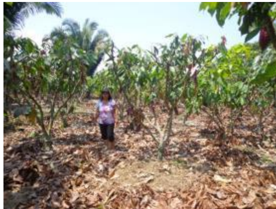
Foto 22: Parcela demostrativa en la localidad de Nuevo Horizonte.