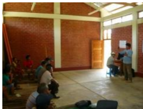
Foto 26: Socialización de avances y logros del proyecto en el 2013 – localidad de Dos de Mayo-diciembre 2013.