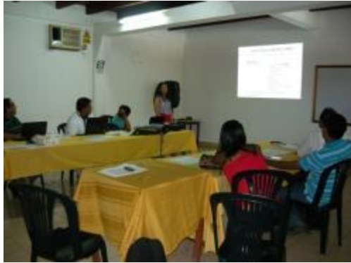
Foto 30: Participación del equipo en temas de marco legal empresarial