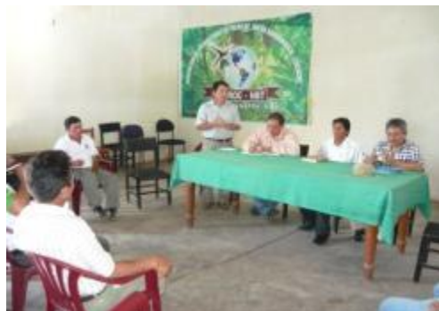
Foto 35: Reunión con Directivos de ASPROC NBT– en Nueva Bambamarca – 27 de diciembre.