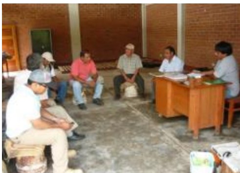
Foto 36: Reunión con Directivos de CAIP– en Nuevo Progreso – 27 de diciembre.

En el 2014 también se elaboraron notas de prensa para promover y comunicar los diferentes eventos realizados por el proyecto, los cuales se publicaron en los diarios locales, publi-reportajes donde se difunden las campañas médicas realizadas y las ferias de servicios agrarios, además de otras actividades relevantes que se realizaron en el proyecto; también se elaboraron spots radiales, para la promoción de las Técnicas de Abonamiento y Podas Sincronizadas, las que fueron difundidas en medios radiales y televisivos en el ámbito de intervención del proyecto.