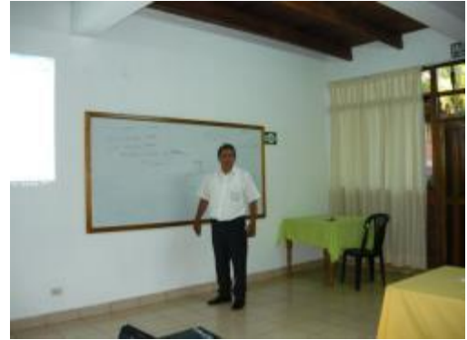
Foto 31: Participación del equipo en temas de gestión económica y financiera.