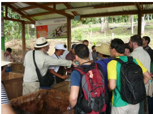
Foto 70: Chocolateros visitando el centro de acopio de Allima Cacao