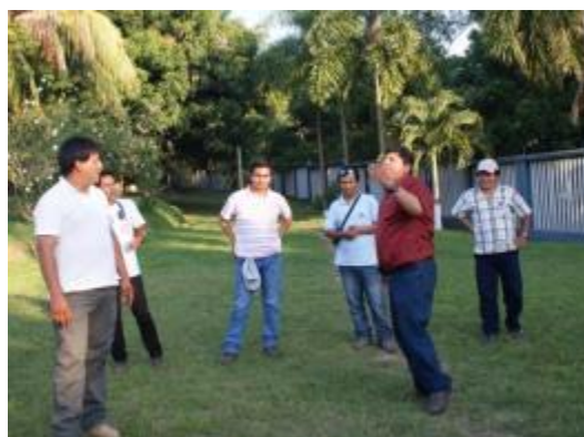
Foto 73: Dinámica grupal durante la capacitación ECA realizada en el ICT.