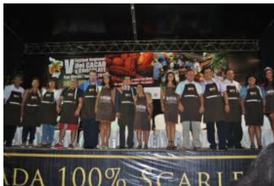
Foto 42: Ceremonia de inauguración del V Festival Regional del cacao y chocolate – 28 de junio 2013