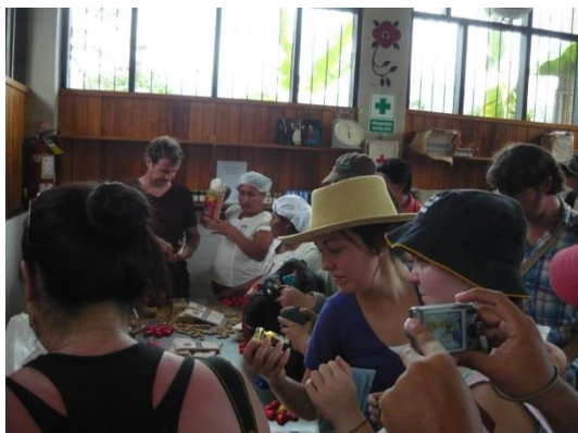
Foto 71: Chocolateros visitando el centro de producción de Mishki cacao.