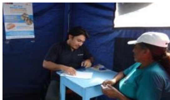
Foto 23 y 24: Atención médica –feria de servicios de salud en la localidad de Santa Rosa de Shapaja – Provincia de Tocache.

En el año 2014 se realizaron dieciocho campañas médicas que permitió atender a 1,924 productores en servicios de medicina general, enfermería, obstetricia, odontología, laboratorio clínico, inscripción al seguro integral de salud SIS. La distribución se muestra en el cuadro N° 8.