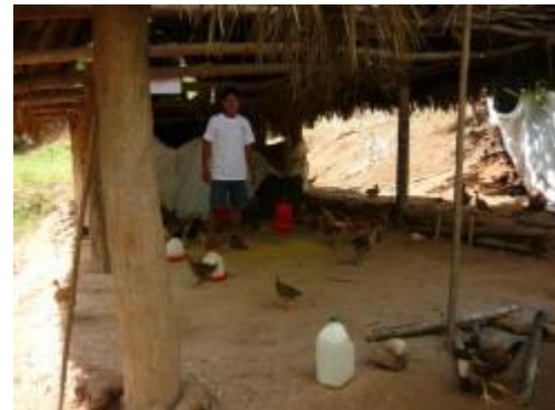
Foto 17: Visita al módulo de crianza de aves de la localidad de San Ramón – 12 de diciembre.