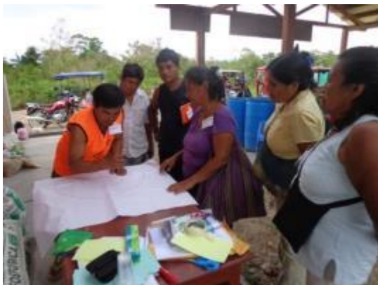
Foto 76: Grupo 1 realizando el Diagnostico Participativo Rural – Manteca - CAIP