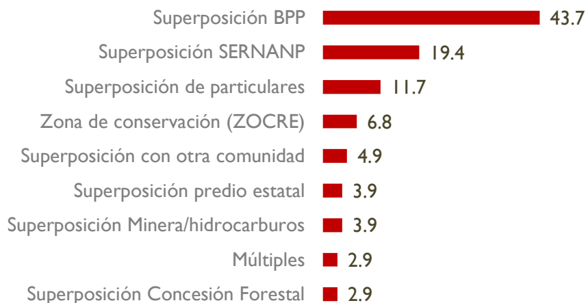
Gráfico 3 CONFLICTOS POR TIERRAS DURANTE EL PROCEDIMIENTO DE TITULACIÓN, 2017 (%)