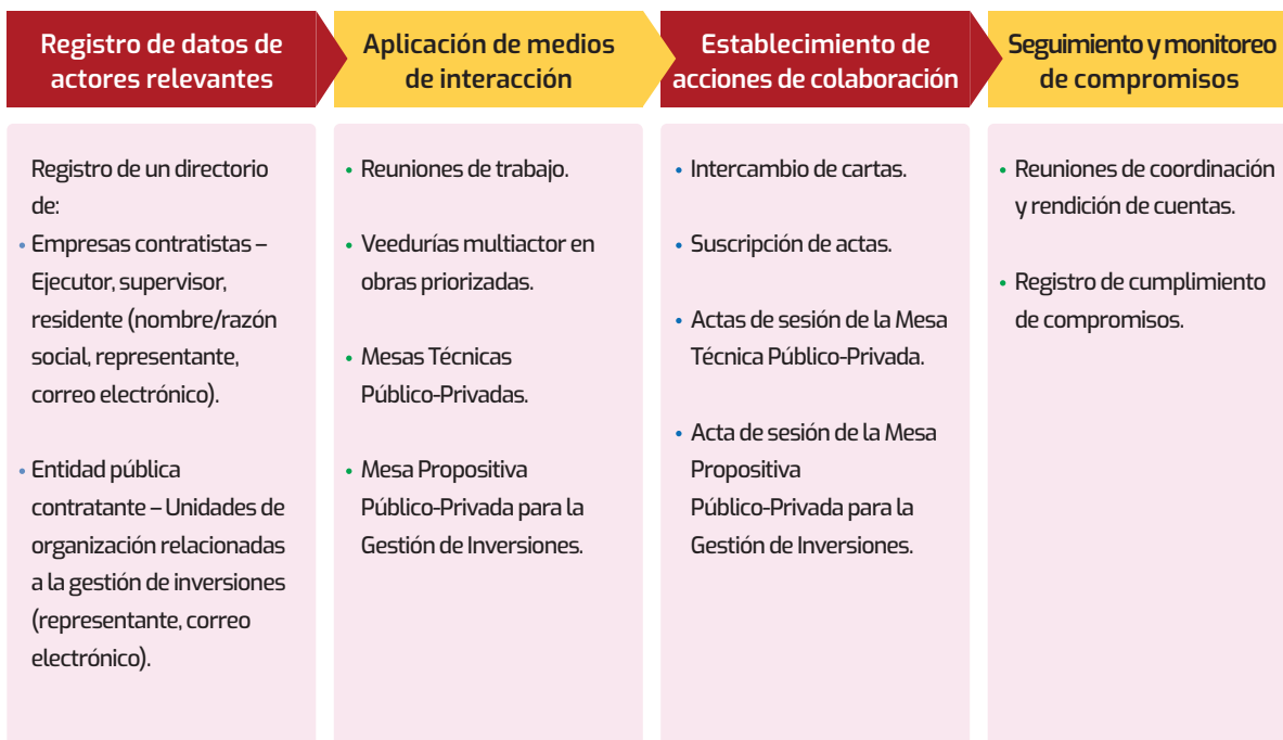
Figura 1: Resumen del flujo de actividades

Una vez formalizada la acción de colaboración, la Red de Integridad debe realizar seguimiento al cumplimiento de los acuerdos por parte de los actores involucrados. Para ello, la Red de Integridad convoca a reuniones de coordinación y elabora reportes de avance y resultados. Estos reportes son socializados con los actores involucrados y otras partes interesadas (ver anexo 6).